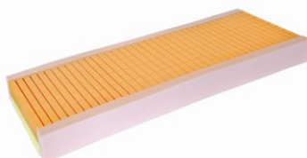
Hospital PLUS 14