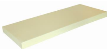
Hospital MONO 12