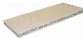
Hospital optimal 14